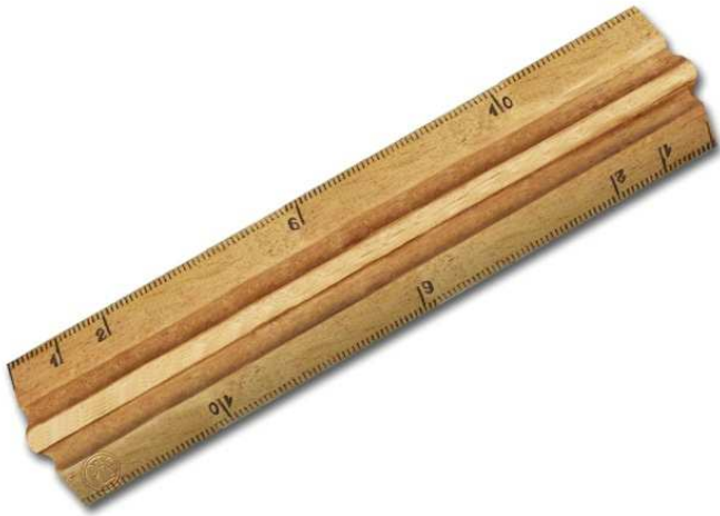
D'après « The incredible Dr Matrix » - Martin Gardner 1967