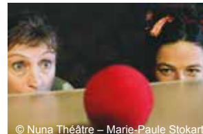
© Nuna Théâtre – Marie-Paule Stokart

D'autres représentations sur Saint-Quentin-en-Yvelines :